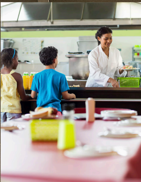
HOTÉIS E RESTAURANTES